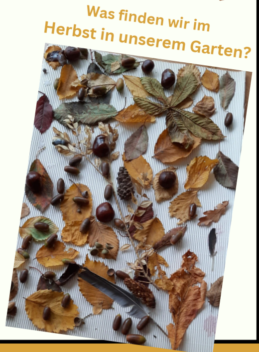
Was finden wir im Herbst in unserem Garten?