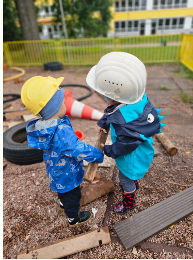
Auf der Kinderbaustelle ist immer was los!