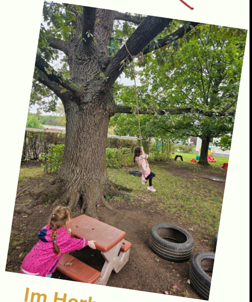
Im Herbstdschungel von den Seilen springen...