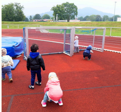
Ausflüge ins Stadion mit den Aller kleinsten - TOR!