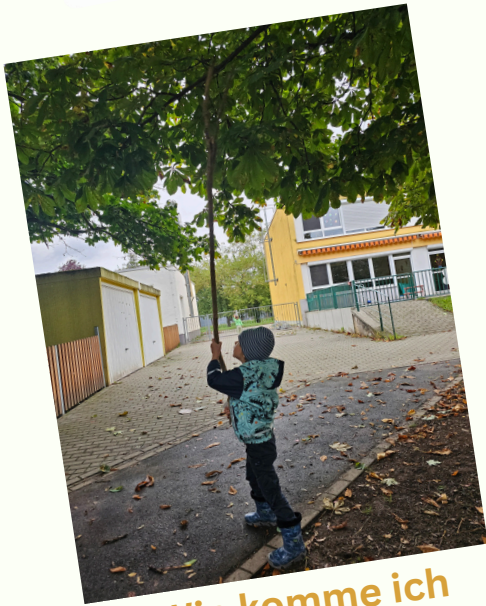
“Wie komme ich an die Kastanien?”